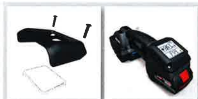
■ ユーザーインターフェースカ 過酷な作業環境でも バッテリーをしっかりと保護