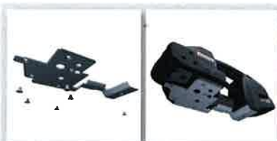
■ 保護プレート 粗い表面での使用に最適