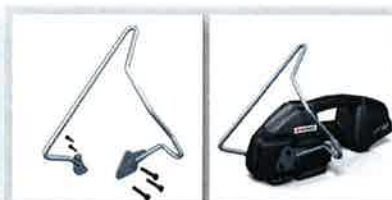
■ サスペンションブラケット 静位置用